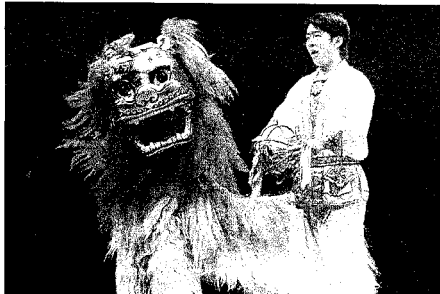
El tradicional dragón chino no podía faltar en un espectáculo lleno de magia y de sorpresas para todos.

El número total de integrantes de la compañía es de 20 personas, 16 de las cuales son artistas a los que hay que sumar todo el personal auxiliar sin cuya colaboración no se podría actuar.