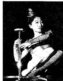
El contorsionismo también estuvo presente en la sala.