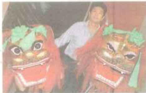
El director de la Troupe Acrobática Tianjin, el pasado lunes en Zaragoza

"La formación de un acróbata es muy dura, pero es un orgullo llegar alto en la profesión"