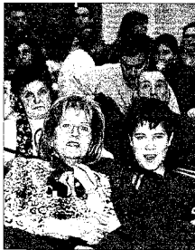
Gente de todas las edades acudió ayer al Buero.