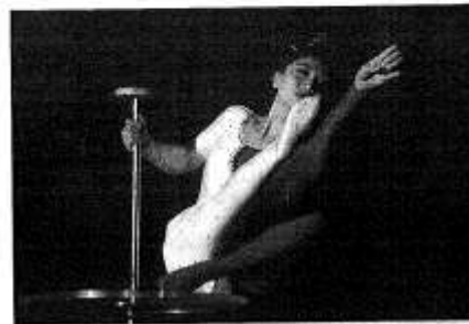
Una de las contorsionistas de la compañía oriental. A RAFAEL GONZÁLEZ GUADALAJARA