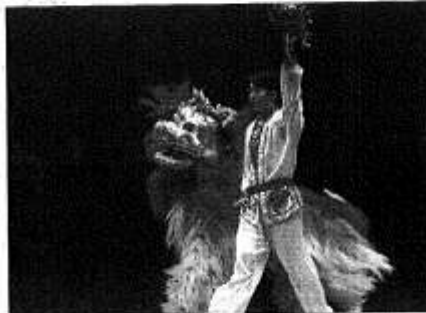
El primer número de los acróbatas de Tianjin. A RAFAEL GONZÁLEZ GUADALAJARA

Los números más vistosos los ofrecieron los saltos y las contorsiones corporales, impresionantes en el caso de una joven que mientras realizaba escorzos imposibles jugueteaba con decenas de velas prendidas de fuego. Admirable fue también la pieza de las pelotas, la de lasillas (sencillo e increíble) y sobre todo la del mesocido, con un mazo que se colocaba platos en la cabeza. En esa su escuela magia. Y cómo no, esta compañía china tuvo un recuerdo acrobático hacia los Juegos Olímpicos. Pero no era un guiño a Madrid 2012 como pensaron numerosos espectadores. Se refirían a los más cercanos y reales Pekín 2008,