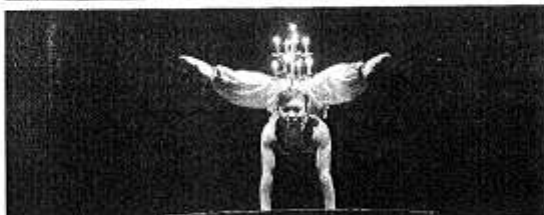
Un moment de l'espectacle de Temporada Alta, al·lè al migdia al Teatre Sant Domènec.